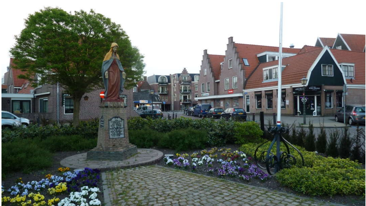
Het oorlogsmonument op het Pelliersplein

Kom om 17.30 uur naar de Mariakerk voor een korte generale repetitie voorafgaand aan de herdenking.