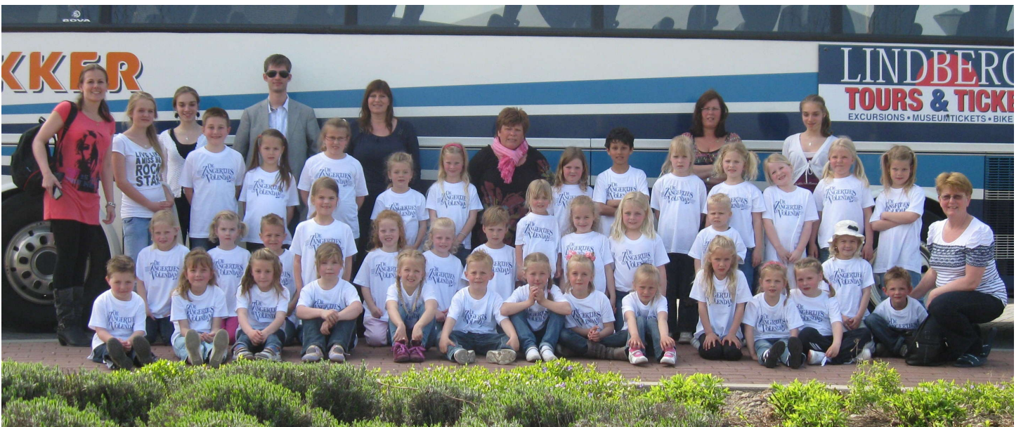
De Benjamins en aspiranten hebben genoten van een schitterende dag in de dierentuin