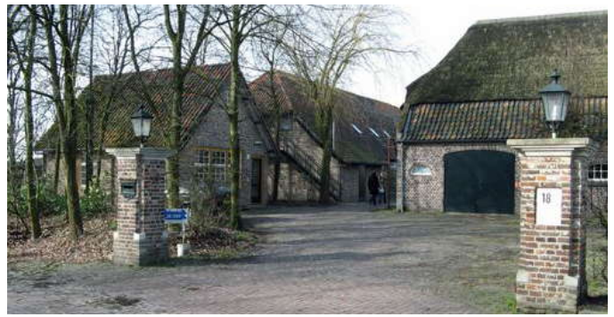
Mooi verblijf voor de jeugd in Brabant

We gaan daar niet meer warm eten, dus zorg dat je van tevoren gegeten hebt. Wel mag je een broodje meenemen om in de bus te eten.