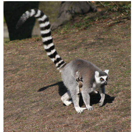
ringstaarmaki met jong

Het was een prachtige zonnige dag waar we graag op terug kijken. Graag willen we de begeleiders nog bedanken voor hun inzet.